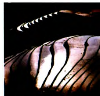
Террасные поля Хребет Дракона